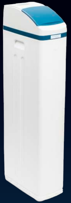
2000 SHE Plus