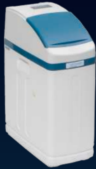
800 SHE Plus