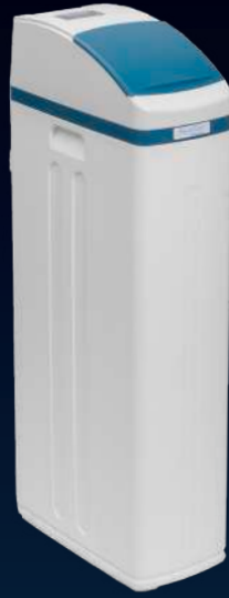
1400 SHE Plus